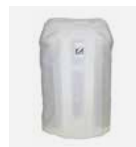
Sacca di protezione invernale